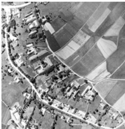
Letecké snímky vesnice Větrkovice z roku 1937 (vlevo) a z roku 1958. Na obou snímcích je horní část vesnice s pozemky, na kterých bylo později vybudováno zemědělské družstvo.