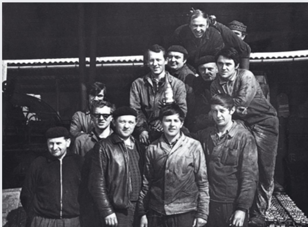
Pracovníci dílen – na horním snímku v březnu 1970 a na dolním snímku 29. prosince 1989.