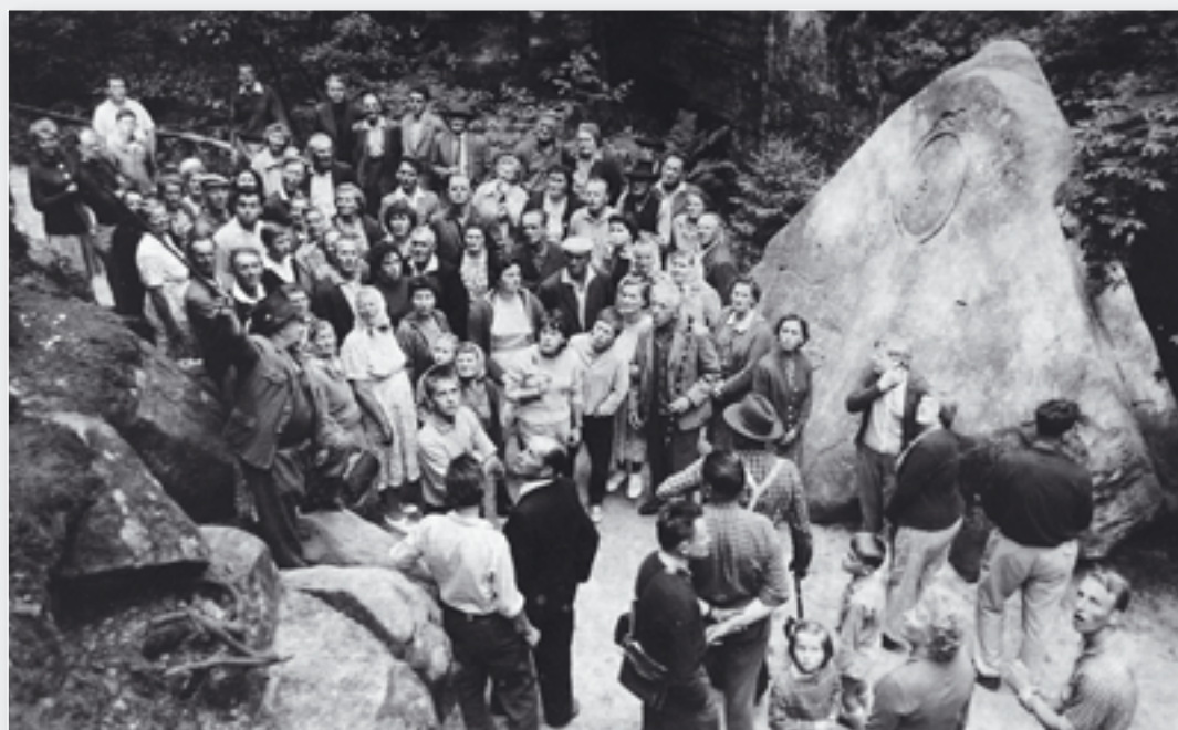
Z výletu družstevníků do Adršpachu.