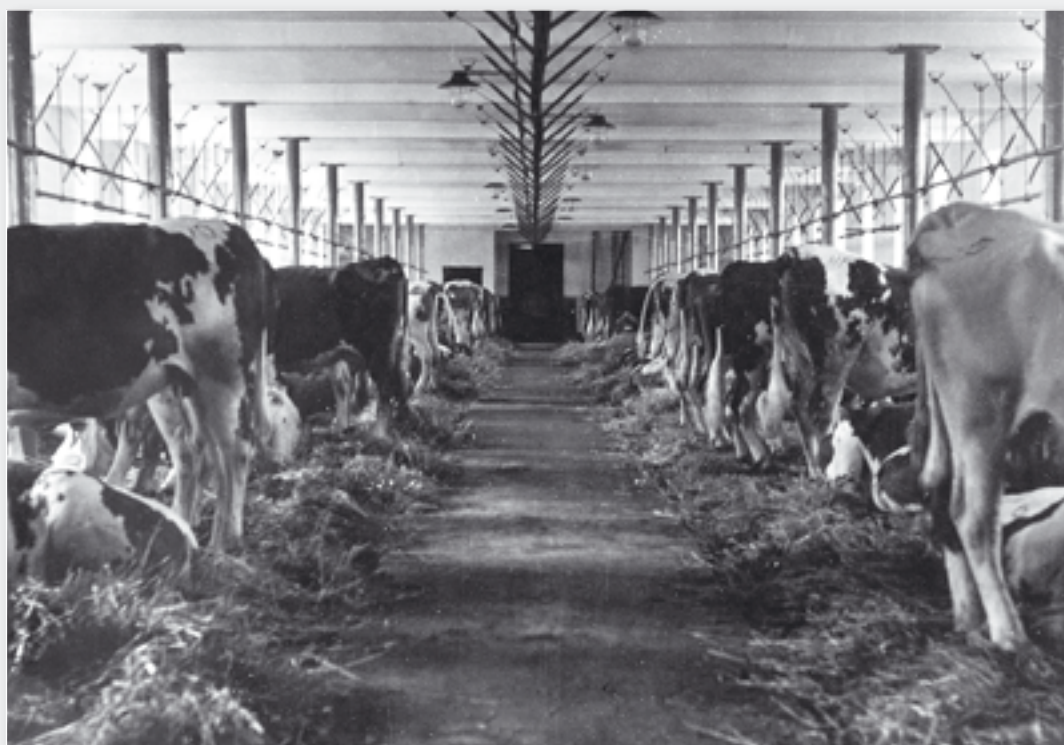
Vazné ustájení dojnic v původních kravínech z 60. let.