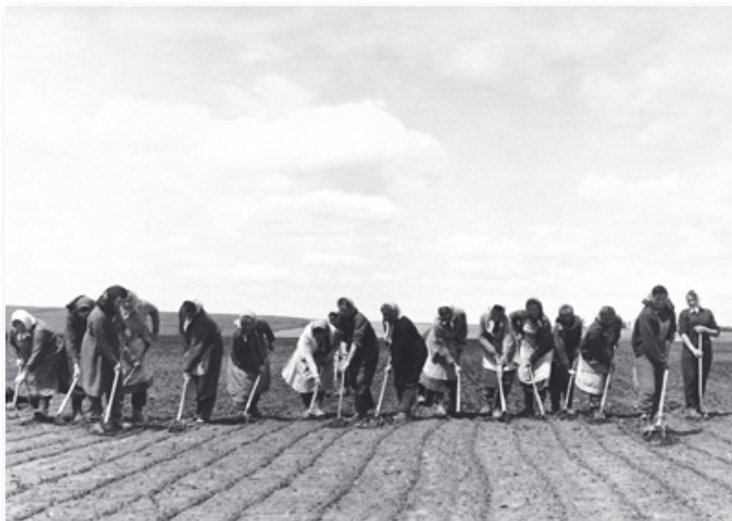
Okopávka a jednocení řepy.