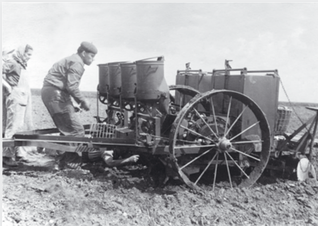
Sázení brambor speciálním sazečem, který obsluhoval Vladimír Vladař – na snímku.