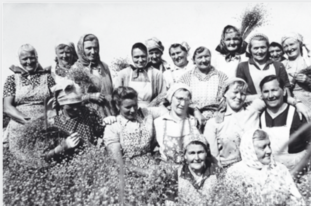
Skupina žen při sklizni lnu.