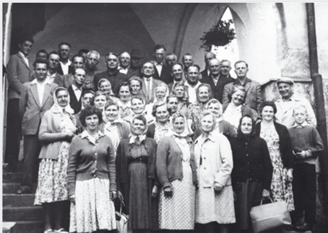
Ke každodennímu životu patří nejen práce, ale také chvíle oddechu. Družstevníci na zájezdě.