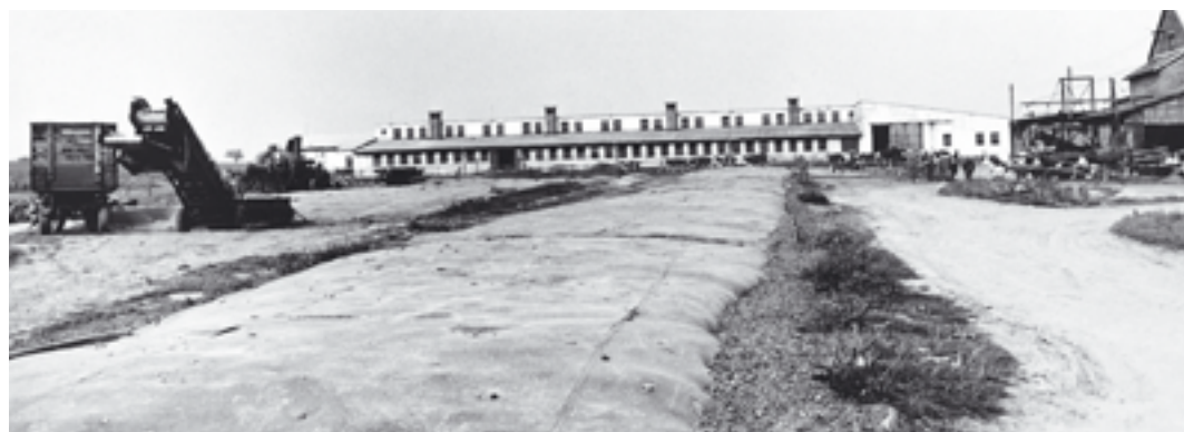
Výstavba čtvrtého kravínu v roce 1965. V popředí jsou silážní žlaby.

V osmdesátých letech se mladý dobytek ustájil do nově vybudované odchovny. Průběh výstavby jednotlivých objektů na středisku ve Větrkovicích je zřejmý z přílohy, ve které jsou uvedeny termíny kolaudace těchto staveb.