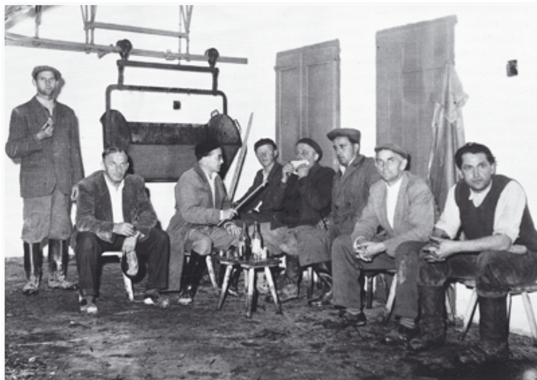
Porada techniků ve stáji v přípravě krmení v šedesátých letech.