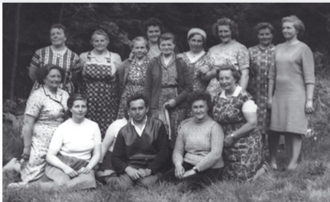
Skupina rostlinné výroby při oslavě svátku Marie.