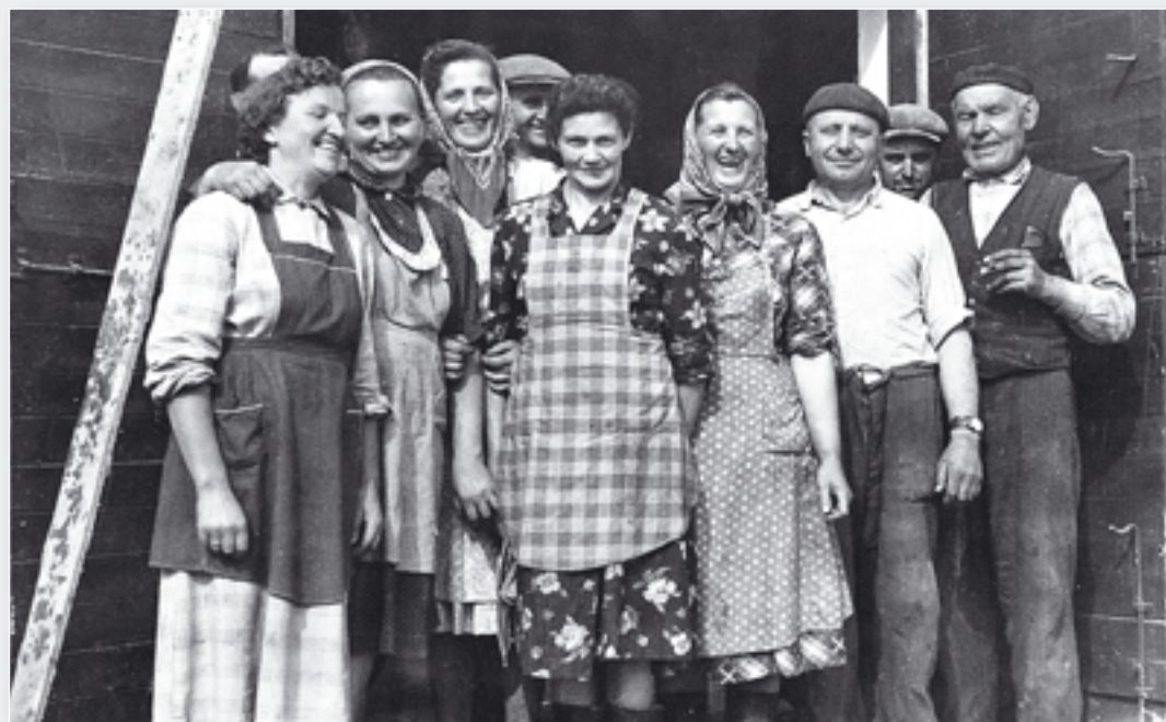
Pracovníci živočišné výroby.