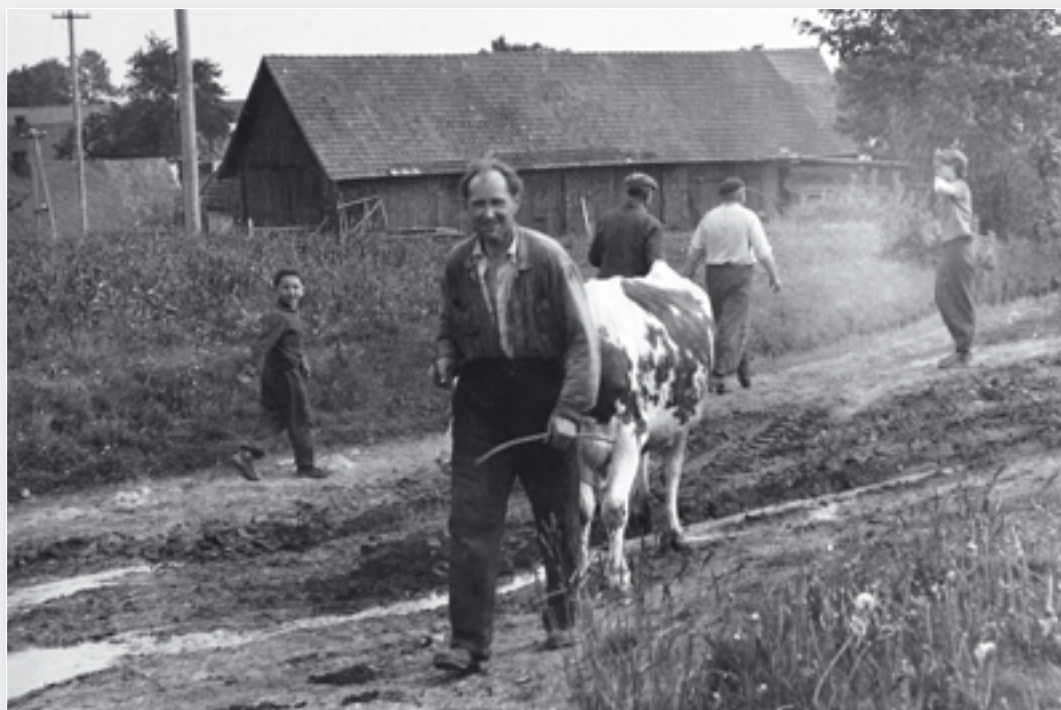
Nejstarší fotografie z roku 1960, kdy sedláci přiváděli krávy do prvního kravinu.