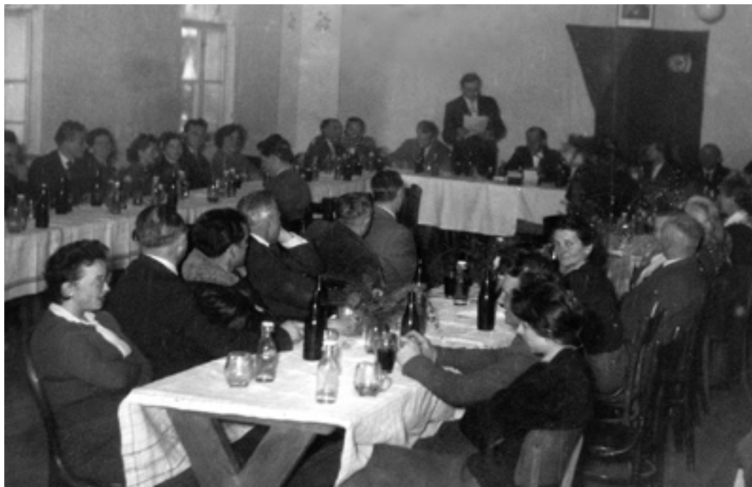
Na snímku z roku 1960 před sloučením.