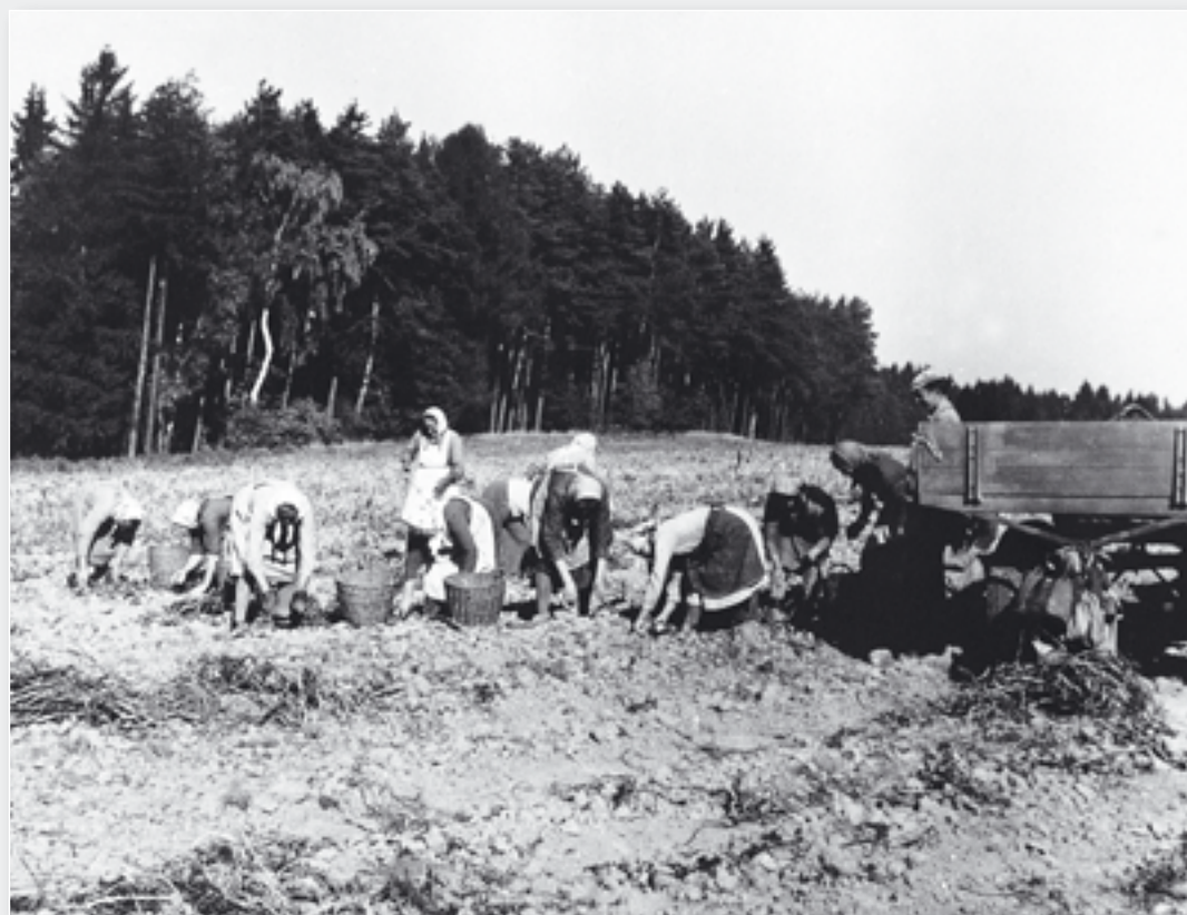
Sklizeň brambor – ruční a kombajnová.