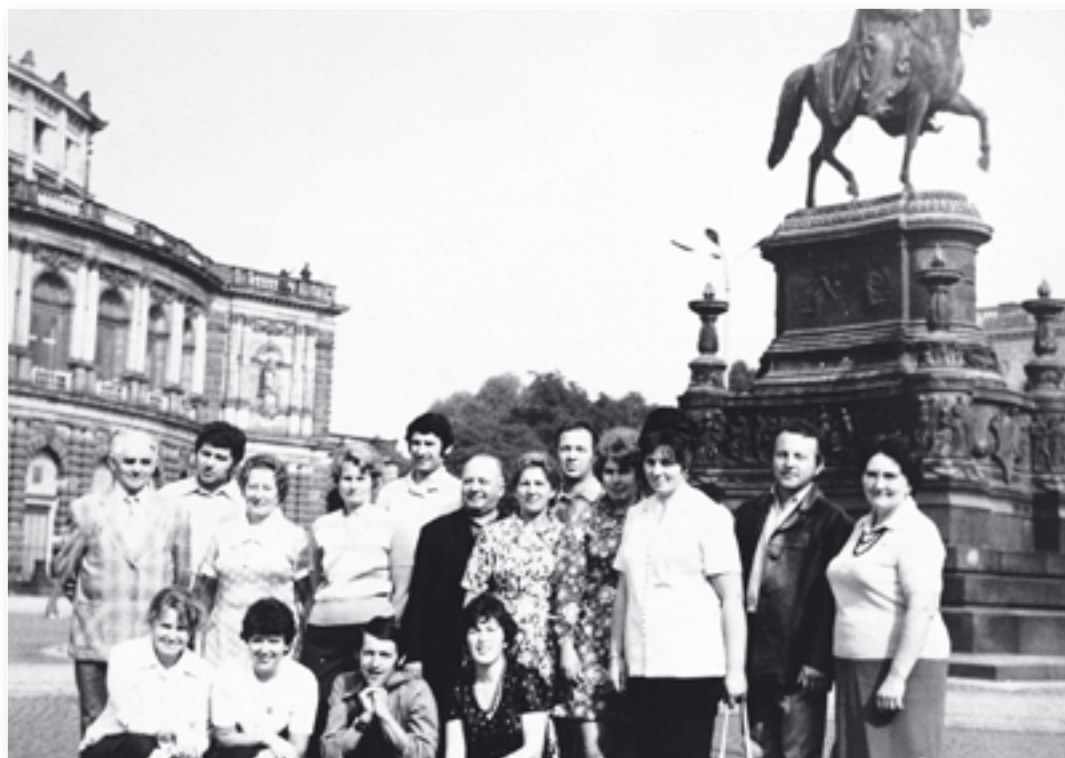
Vzpomínka na zájezd do Prahy.