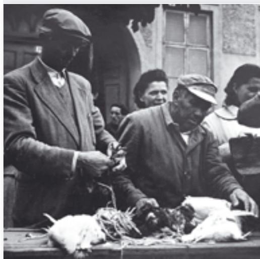
Prodej slepic na náměstí ve Vítkově.