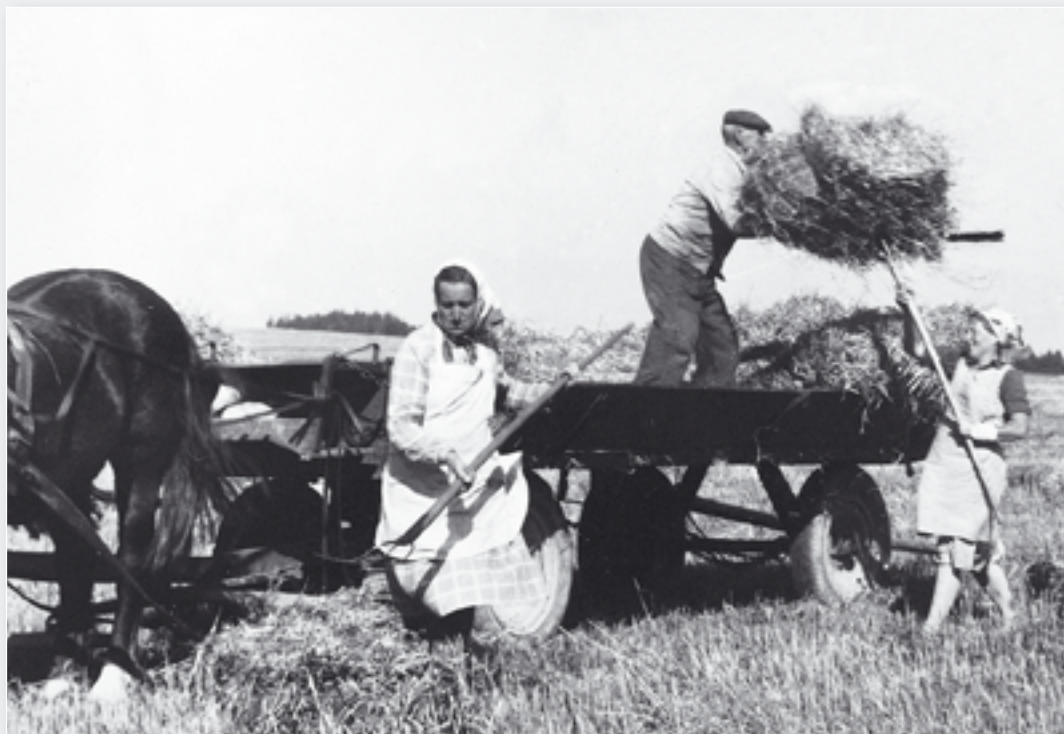
V šedesátých letech se většina polních prací dělala ručně a dopravním prostředkem byl koňský vůz.