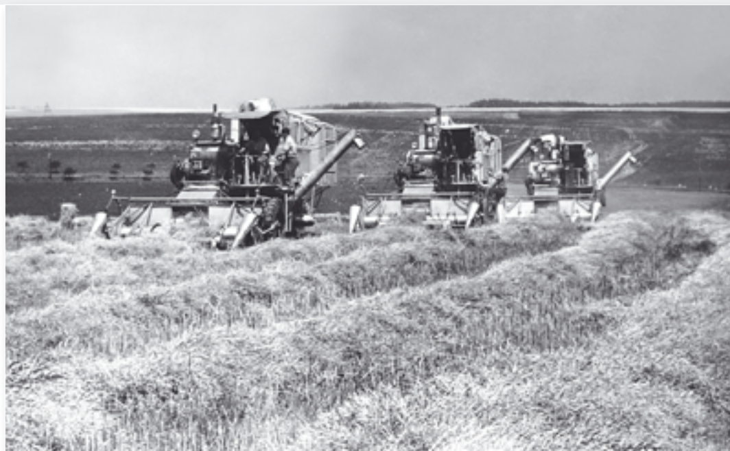
Skupinové nasazení kombajnů při sklizni obilí.