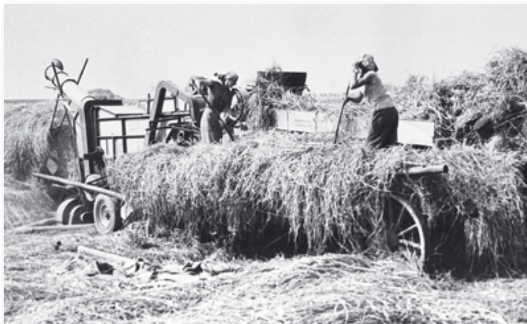
Výmlat obilí v šedesátých letech.