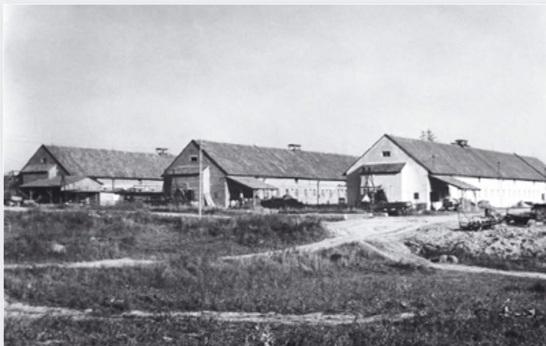
Tři nejstarší kravíny na středisku ve Větrkovicích.