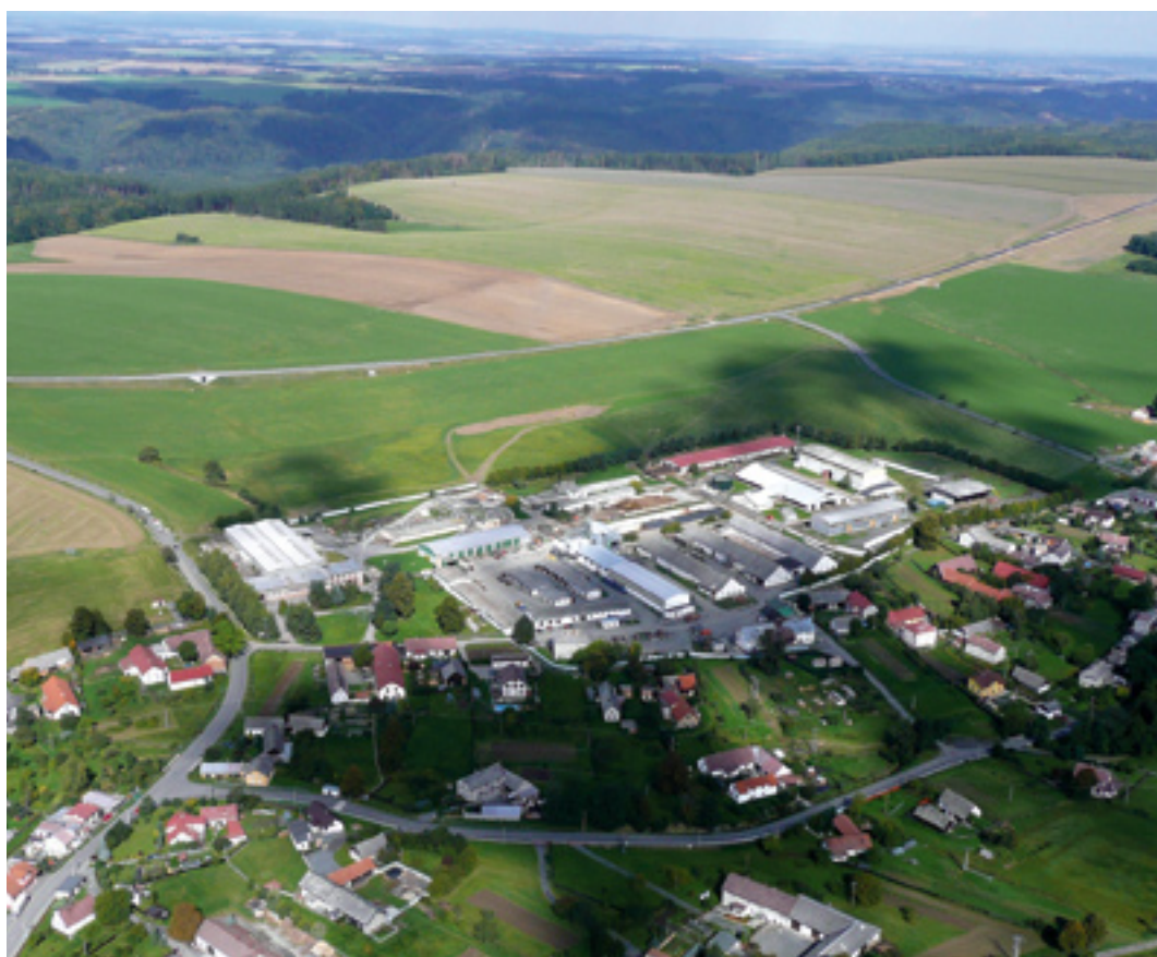
Takto vypadá horní část Větrkovic s areálem ZOD Slezská Dubina v současnosti.