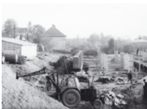
Výstavba kulturního domu ve Větrkovicích.

Většina staveb, které pochází z 60 až 80 let byla postavena stavební skupinou zemědělského družstva. Nelze nezmínit výstavbu bytoven, opravy rodinných domů, zajímavou výstavbu našeho kulturního domu, kdy společně s obcí se sdružily finanční prostředky.